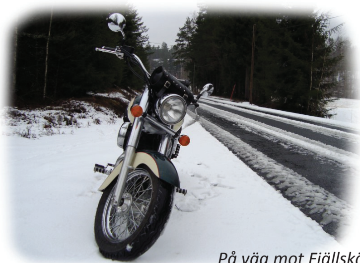
På väg mot Fjällskäfte

Turen gick den vanliga vägen. Väglaget var bra och nästan helt snöfritt fram till Svalboviken.