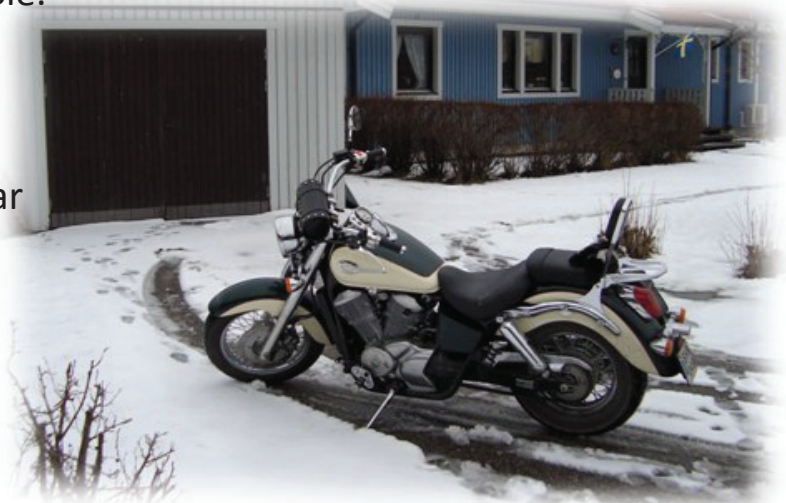
”- Här var det ingen hemma”